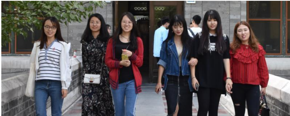
北京理工大学的同学们漫步在九号院长廊

在欢声笑语中我们一起度过了一个难忘的上午时光。晌午时分在新科研楼805 共聚午餐，庆祝本次活动取得圆满成功，并在此留下了医理两院的友谊合影。