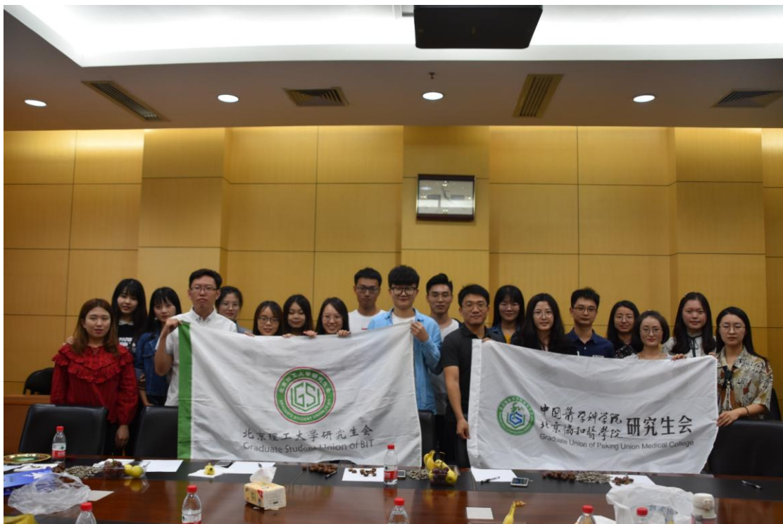
全部参会者集体合影留念

在欢声笑语中我们一起度过了一个难忘的上午时光。晌午时分在新科研楼805 共聚午餐，庆祝本次活动取得圆满成功，并在此留下了医理两院的友谊合影。