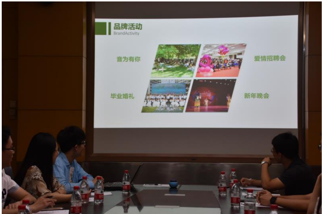
北京理工大学研究生会代表正在展示理工校园风采