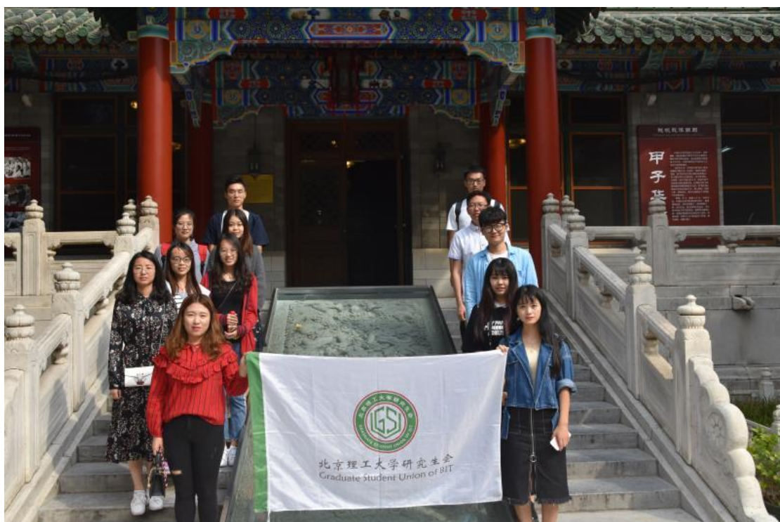
北京理工大学研究生会集体在东单九号院合影留念